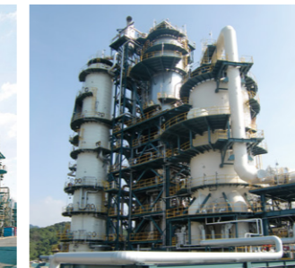
残油流動接触分解装置

減圧蒸留装置で残渣油から分離された減圧軽油を、水素ガスと混合し、高温高圧雰囲気中で触媒と反応させ、高品質のナフサ・灯油・軽油を製造します。