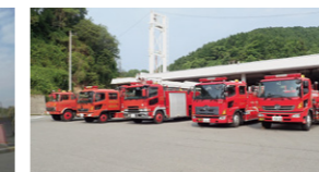
防災センターと化学消防車群