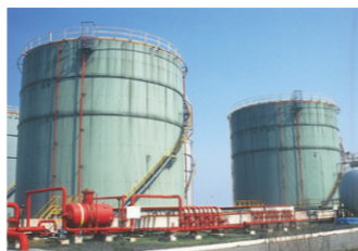
原料・製品貯蔵設備