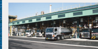
四国事業所 陸上出荷設備