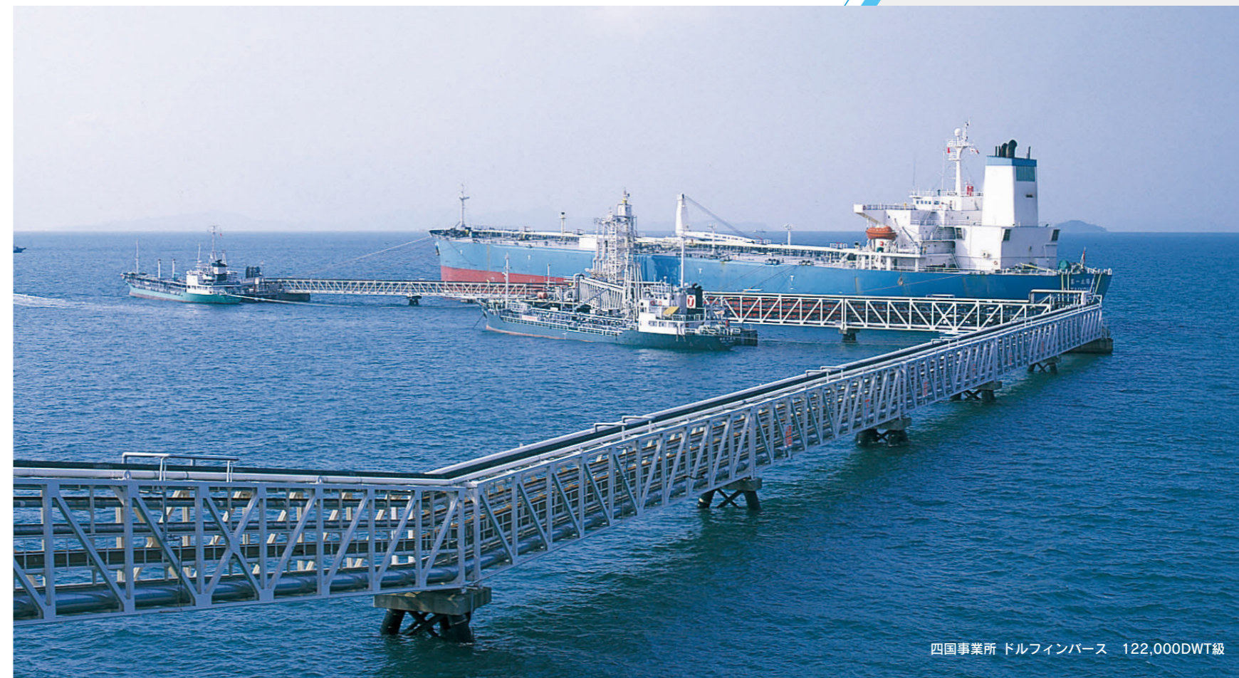
四国事業所 ドルフィンバース 122,000DWT級

太陽石油はお客様のさまざまなニーズに応えるため、地球に優しい製品を安定供給しております。毎日の暮らしのためだけでなく、産業活動の中でも広く活用される石油製品を、安全・確実にお届けするため、生産設備の合理化、流通施設の・拡充に取り組み、安定供給に万全の態勢で取り組んでおります。