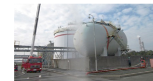
消防隊による泡放水消火活動

両事業所では、自衛防災組織を設置しています。定期的に防災訓練を行うことで、自衛防災隊の迅速な防災体制の確立と、防災活動の習熟を図っています。