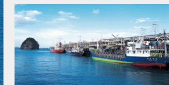
四国事業所 海上受入・出荷設備

四国事業所 試験分析センター 製品の試験分析と品質管理、製品の品質向上、有害物質の除去、環境・エネルギー関連の技術研究・開発等を実施しています。