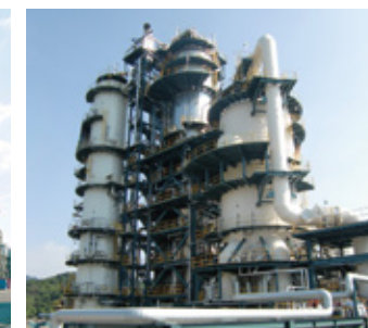
残油流動接触分解装置 原料である重油を高温低圧雰囲気中で触媒と接触させることで分解し、プロピレン・LPG・ガソリン留分を製造します。