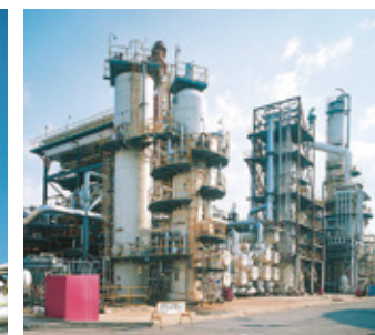
水素化分解装置 減圧蒸留装置で残渣油から分離された減圧軽油を、水素ガスと混合し、高温高圧雰囲気中で触媒と反応させ、高品質のナフサ・灯油・軽油を製造します。