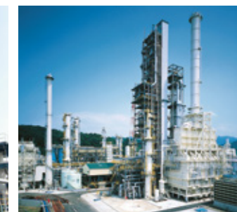
BTX設備 原料であるナフサに水素化処理や接触改質処理を行い、得られた改質油を蒸留・抽出、トランスアルキル化することで、ベンゼン・キシレンを製造します。