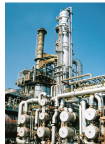
常圧蒸留装置 原油を蒸留し、LPG・ナフサ・灯油・軽油・残渣油の各留分に分離します。